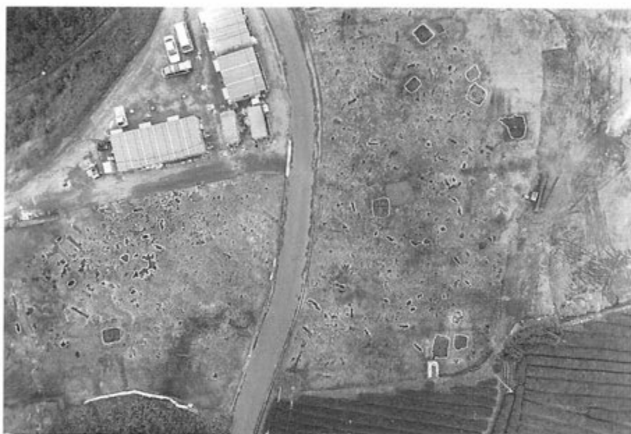
前原遺跡 《所在地：日置郡松元町福山》