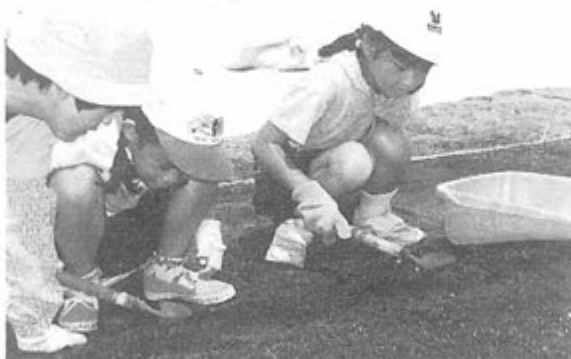
何か出てこないかなあ…

当日は午前中に開会式や前原遺跡の紹介があり、その後に早速、発掘体験をしてもらいました。参加者の児童・生徒は待ってましたとばかりに手に道具を持って掘り始めました。最初は遺物が出るかどうか不安だったようですが、ぞくぞくと土器のかけらなどが見つかって「出たよ!」という声があちこちから聞こえてくるようになりました。最後には、子供より保護者のほうが熱中している場面も見られました。