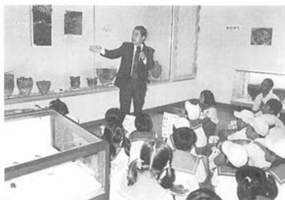
展示資料の説明をうける児童・生徒達

第2回目は、8月2日から8月26日まで高山町歴史民俗資料館において開催しました。