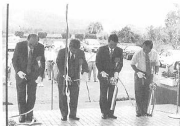
高山町会場テープカット

開催にあたっては、種子島総合開発センターの方々が創意・工夫をされ、古代服を着て、はさみの代わりに黒曜石を使つてのテープカットをしたり、小学生は古代服を着て土器作りや火おこしなどの体験学習も行いました。また、「鉄砲館」とも呼ばれる同センターにはたくさんの火縄銃が展示され、県内外から数多くの観光客が訪れます。観光で訪れた方々も巡回展を見学され、喜んで帰られたそうです。