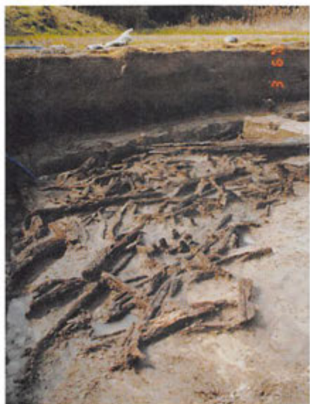
木製品の出土状況

京田遺跡は川内市中郷町にあり、九州新幹線鹿児島ルート建設に伴って発掘調査が行われました。遺跡は、現在水田として利用されている水はけの悪い場所に立地しています。このような水分の多い場所では、昔の人々が作った木製の道具が腐らずに残っていることがあり、当遺跡からは弥生時代（約2,000年前）の人々が土を耕したり掘ったりするのに使った木製の鍬や鋤と、平安時代（約1,000年前）の文字が記された木の杭などが見つかっています。県内では木製の道具はあまり発見されていないので、昔の人々の生活を考える上で貴重な発見になりました。この近くには奈良・平安時代の薩摩国分寺跡があり、その関係が注目されます。