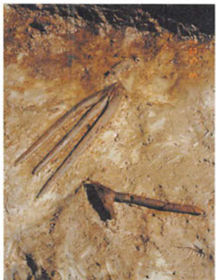
弥生時代の又鍬と柄