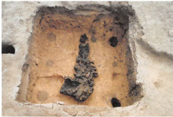
炭化した木片の残る建物跡