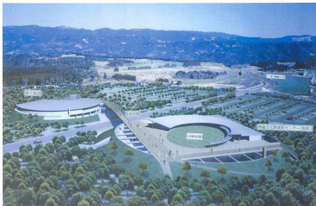
埋蔵文化財資料センター(仮称)完成予想

国内で最古・最大級の定住集落跡の上野原遺跡は、 「上野原縄文の森」(仮称)として平成14年度のオープンに向けて現在整備が進んでいます。この「縄文の森」は、 国指定史跡を含め36haの面積があり、県内外の遺跡を ジオラマ模型などで紹介する展示施設や復元集落などの 見学エリアと、埋蔵文化財資料センター(仮称)や「祭りの広場」などの体験エリアの2つのエリアに分かれています。