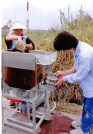
ウォーターフローテーションの様子

国道220号古江バイパス建設に伴い調査された根木原遺跡で、古墳時代（約1500年前）の竪穴住居跡が検出されました。住居内の土を、水を利用して土の中から炭化物を取り出すウォーターフローテーション（浮遊選別法）という方法で調べたところ、炭化した山椒の一種と思われる種子や雑穀類とみられる種子が発見されました。当時の人びとが何を食べていたのか、どんな植物があったのかを調べる手がかりとなるでしょう。まだまだ作業の途中であり、これから他の種類の種子が見つかるかもしれません。