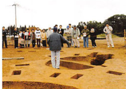
三角山Ⅰ遺跡の現地説明会の様子

3月1日（土）には、串木野市の柵城跡で現地説明会が開催されました。この遺跡では、南九州西回り自動車道川内道路建設に伴い、平成11年度から発掘調査を行ってきました。中世の山城ということで調査に入りましたが、台地上・中腹・低地部などで縄文時代早期の落とし穴や近世の墓墳等さまざまな遺構・遺物が見つかりました。当日は大荒れの天候でしたが、多数の皆さんに足を運んでいただきました。近世墓群や廃仏毀釈で廃棄された良福寺住職の墓石、低湿地部等の見学後、展示コーナーで出土遺物の説明を行いました。特に墨書・刻書土器やカムイヤキ・滑石製品等に注目が集まりました。今後も発掘調査の成果を広くお知らせしていきたいと思えます。