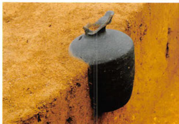
都原遺跡の蔵骨器

西回り自動車道建設に伴い発掘調査された都原遺跡では、蔵骨器の可能性が考えられる9世紀頃の須恵器が発見されました。これは直径10cm、深さ30cm程度の穴に埋められた状態で出土し、頸部はかなり狭いもので、口縁部は現世のものとは区分するために意図的に打ち欠いたと思われる。今後は、中にはいつている土を分析し、中に何が納められていたのかを調べる予定です。