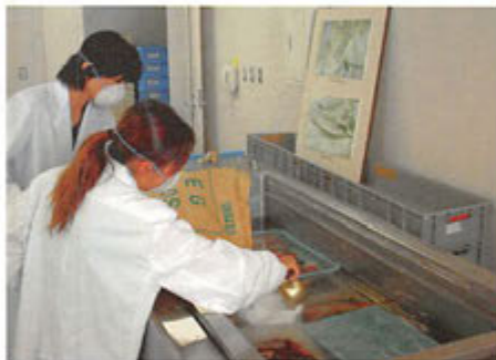
木器の保存処理を行う研修生

大学生等を対象に、職場について学ぶ「インターンシップ」の研修生を受け入れました。県内の大学、高等専門学校から約2週間、9名の学生たちが発掘調査や整理作業などの仕事について学びました。