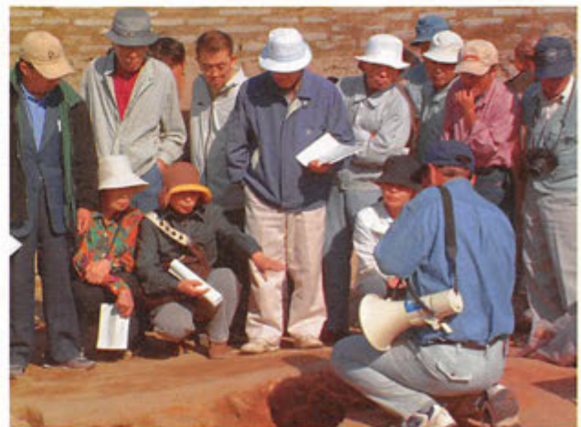
熱心に説明を聞く見学者