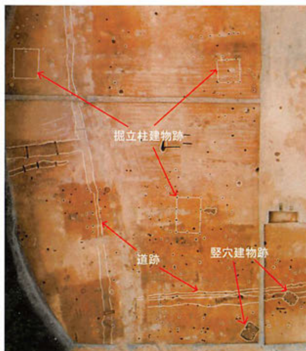
遺跡を真上から見たようす

本年度の発掘調査では、地面に直接柱を立てる掘建柱建物跡や、地面に穴を掘って壁の代わりにした竪穴建物跡など中世の遺構が検出されています。(写真の白い線で囲っているところが遺構のあるところです。)道跡については出土している遺物から判断して、明治時代以降の比較的新しいものだと思います。