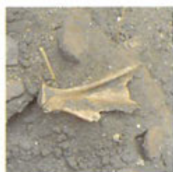
獣骨（下あごと肩の骨）

里村教育委員会は、集落排水事業に先だって平成15年5月から6月まで中町馬場遺跡の発掘調査を実施しました。