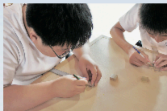
竹細工の材料作り (職場体験学習)