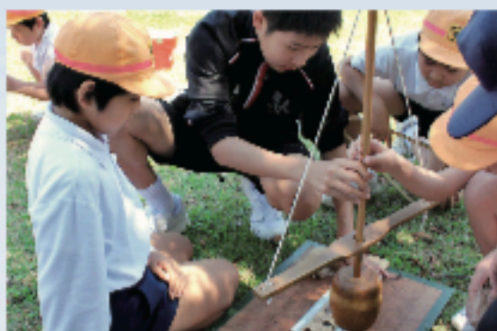
小学生と一緒に火おこし体験 (職場体験学習)

中学校の職場体験学習, 高校のインターンシップを受け入れます。 (8:45~16:00まで)