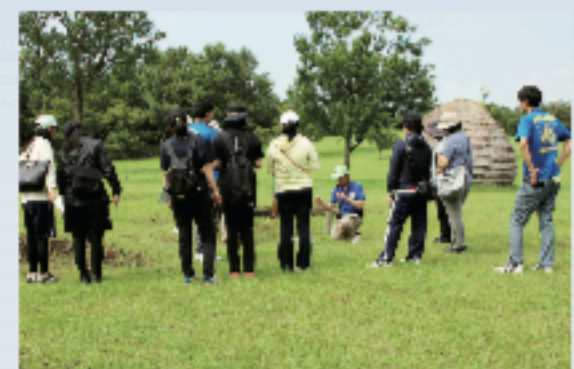
上野原遺跡のフィールドワーク (先生のための考古学講座)